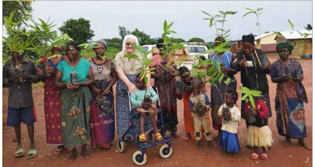
Bambus wird im Schulgarten in Madisi und in den Herkunftsdörfern der Waisenkinder gepflanzt. Die schnell wachsende Pflanze eignet sich später gut als Brennholz.

Die Erfahrung zeigte, wie wichtig Brunnen mit sauberem Wasser sind. Unverzichtbar sind sie dort, wo es keine Wasserleitungen gibt, wie etwa in den Dörfern bei Madisi, wo wir mit Hilfe von Spenden Brunnen bauen. Viele Menschen haben in Malawi keinen Zugang zu sauberem Wasser. Sie verbringen Stunden damit, Wasser aus Bächen, Seen oder Pfützen zu holen, das zudem oft Krankheitskeime enthält. Regelmäßig sterben Kinder an den Folgen verunreinigten Trinkwassers. Besonders Mädchen gehen oft nicht zur Schule, weil sie jeden Tag bis zu 20 Kilometer mit schweren Wasserkanistern zurück-