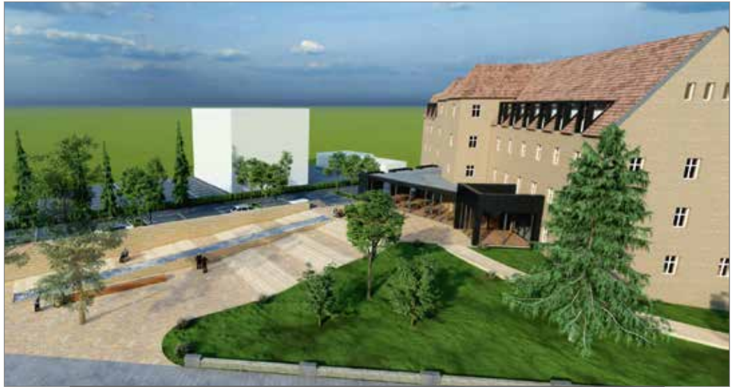
Eine Visualisierung der Umbaupläne sieht ein Foyer und ein Café im Eingangsbereich des Mutterhauses vor. Dieser soll an die zur Innenstadt zeigende Seite verlegt werden. Bild: Wellie Architekten

Wenn das Tau-Haus voraussichtlich im Sommer 2025 fertig ist, steht das nächste Bauprojekt in den Startlöchern. Das Gebäude des Mutterhauses soll dann zu einem pastoralen und sozialen Zentrum umgebaut werden. Hintergrund ist die absehbar kleiner werdende Zahl der Ordensschwestern und der damit verbundene geringere Raumbedarf. „Derzeit werden im Mutterhaus noch alle Räume genutzt, aber die