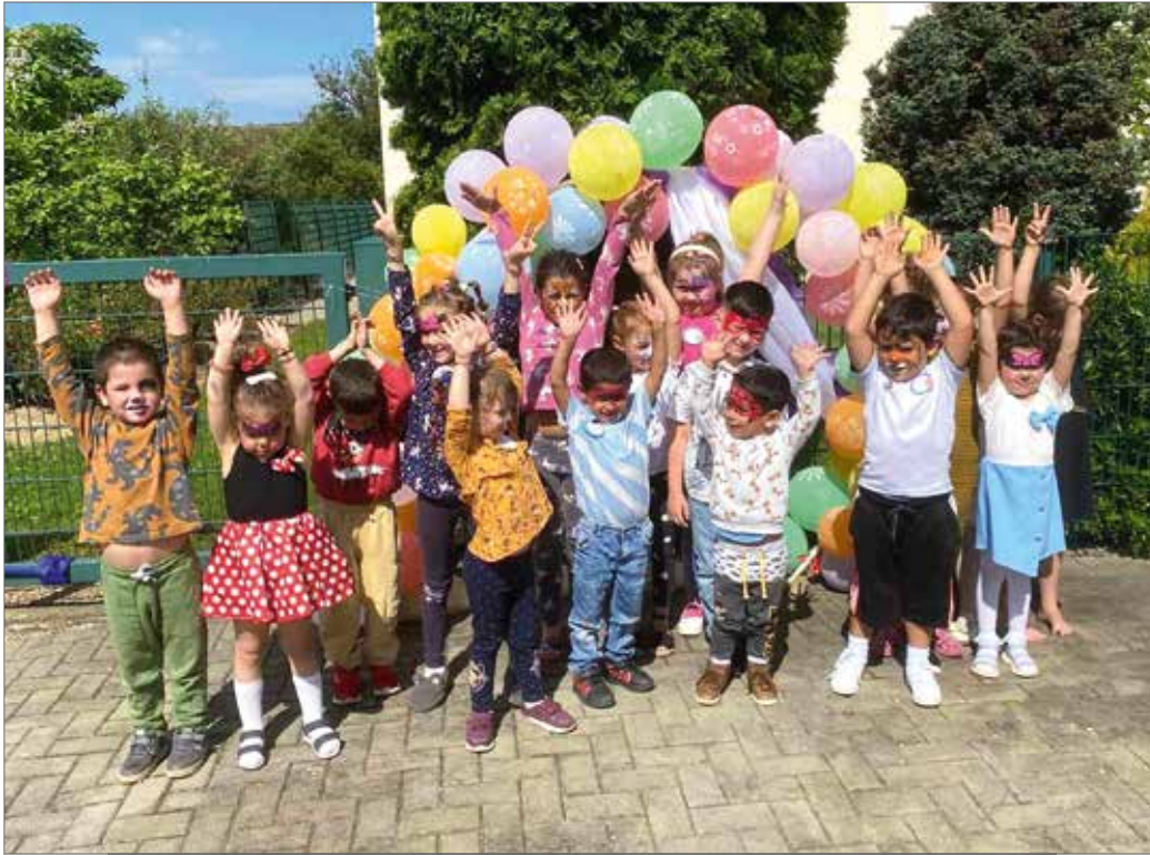
Bei der Feier des Internationalen Kindertages im St.-Ursula-Kindergarten hatten die Kinder viel Spaß.

Rumänien. Manche der Hilfen in Rumänien wirken vielleicht wie ein Tropfen auf den heißen Stein. Diese Tropfen können nicht die Welt retten, aber die Situation vieler Menschen verändern und Hoffnung geben.