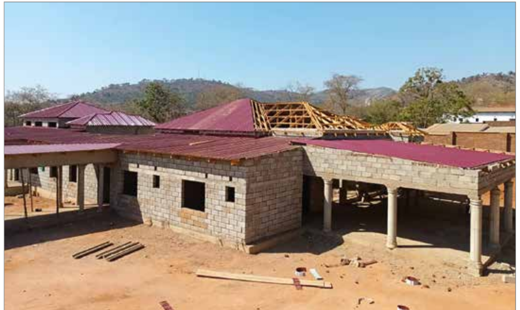
Das neue Formationshaus in Dowa nimmt mehr und mehr Gestalt an. Insgesamt 16 Frauen können sich hier bald auf das Ordensleben vorbereiten.

legen müssen. Brunnen mit sauberem Wasser machen solche Wassermärsche überflüssig und schaffen Freiraum für Bildung und produktive Aktivitäten.